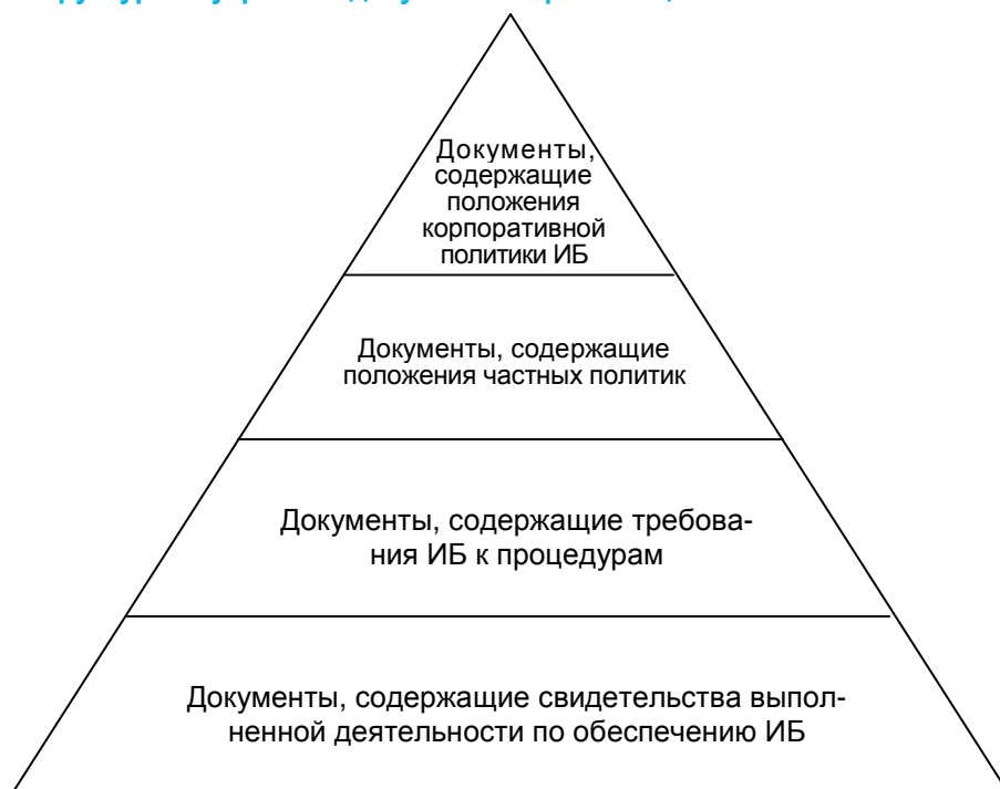
Рисунок 1. Структура внутренних документов организации БС РА по обеспечению ИБ